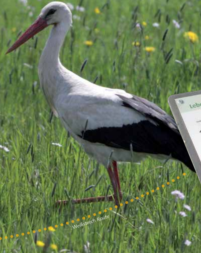
Schau Tafel

Für die Aufzucht der Jungvögel müssen ausreichend Mäuse, Amphibien, Regenwürmer und Insekten vorhanden sein! Ein ausgewachsener Storch benötigt 500 - 700 g Nahrung pro Tag, ein Jungvogel bis zu 1.600 g.