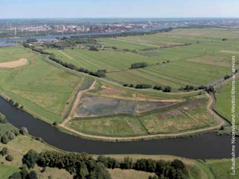
Luftaufnahme Niedervieland-Westital