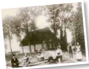
Piepers Gaststätte am Mühlenhauser Fleet

Archäologische Funde belegen, dass im Urstromtal von Weser, Lesum und Ochtum schon um 2500 v. Chr. Menschen im Niedervieland lebten. Diese Flüsse prägten nach der letzten Eiszeit vor 10.000 Jahren das Landschaftsbild. Der Meeresspiegel lag damals um bis zu 20 m tiefer als heute.