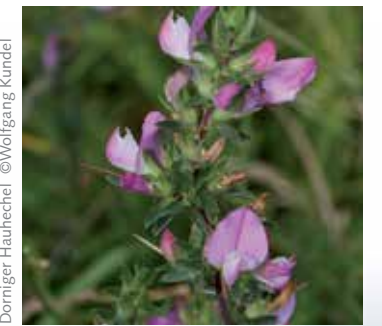
Dorniger Hauhechel

Seit dem Bau eines Tidebiotops „Vorder-/Hinterwerder“ (1996/97) haben sich hier, durch die periodischen Überschwemmungen der Wesertiden, wieder