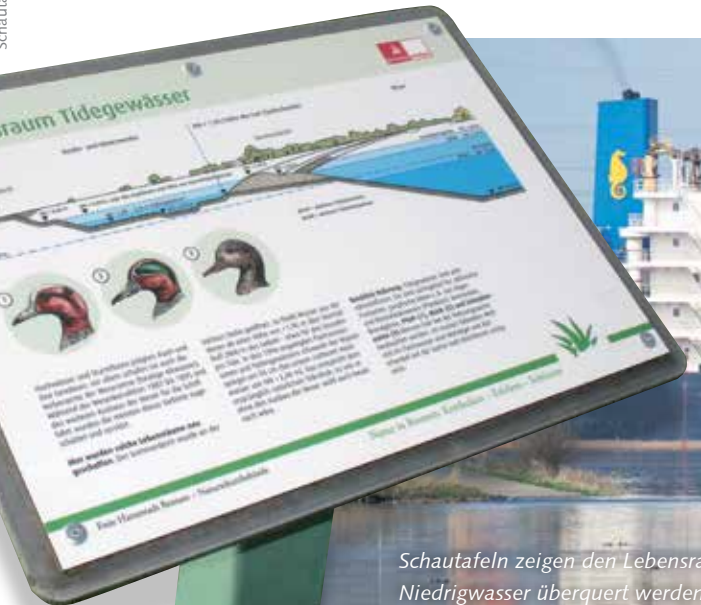
Schau tafeln zeigen den Lebensraum des Tidebiotops und erklären die Funktionsweise der Furt, die nur bei Niedrigwasser überquert werden kann. Selbst dann kann der Übergang noch sehr rutschig sein!