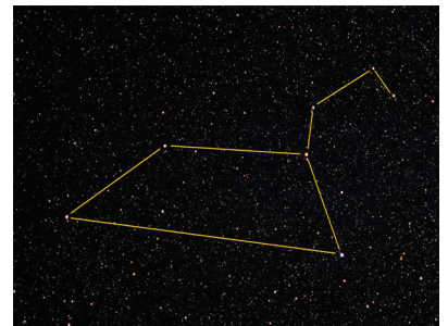
Das Sternbild Löwe am Nachthimmel

Sie können natürlich auch sehr gut mit dem Fahrrad hierher kommen.